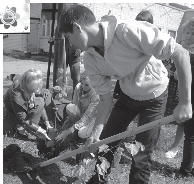
Каждый мужчина должен посадить дерево...

сти сад. Садоводы заверили, что максимум через два года деревья начнут плодоносить. «Пусть дерево, которое я посадил сегодня, — говорит один из подростков, — останется памятью обо-