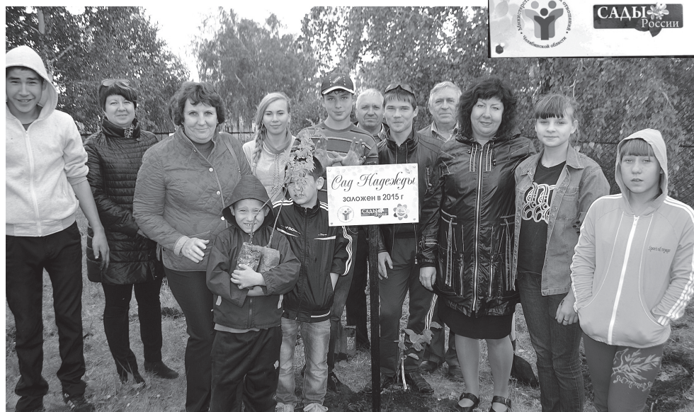
Саженцы посажены, будем ждать плодов

Название благотворительного проекта «Сады надежды» созвучно с именем подовинновского социально-реабилитационного центра — «Надежда». Коллектив воспитателей и детвора готовились к приезду гостей — заранее запаслись