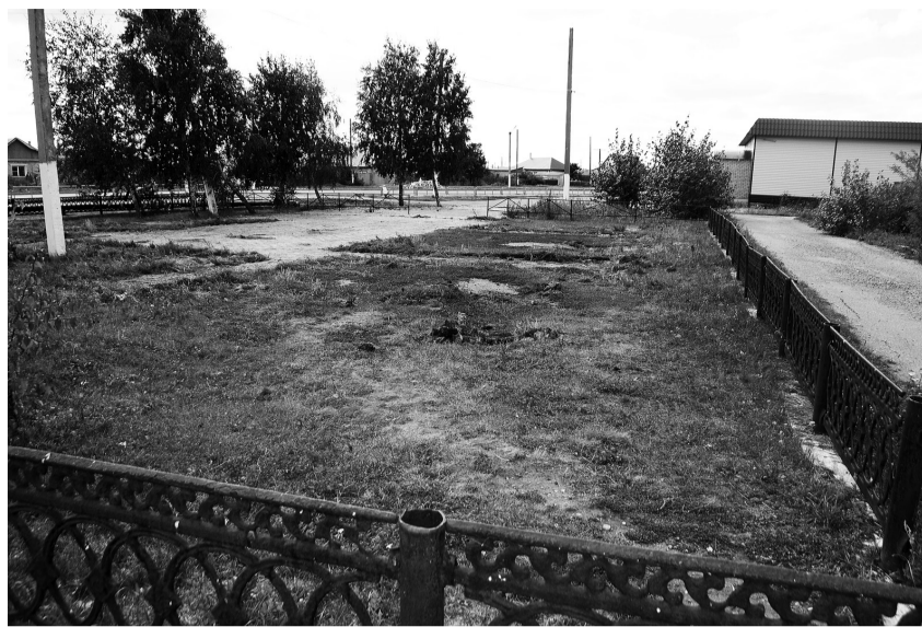
Вместо площадки — пустырь

На очередном совещании депутаты Октябрьского сельского поселения примут решение и определят новое место для установки демон-