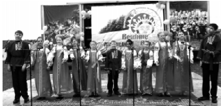
Детский фольклорный ансамбль «Отрадушки» г. Еманжельинск

сто: создать комфортные условия для такого количества гостей, которых встречали хозяева с домашними пышными пирогами. А сама хозяйка с. Каракульское поблагодарила поселения, принявшие участие в проведении фестиваля: Свободненское, Маяжское, Подовинное, Никольское, Чудиновское, Кочердыкское, У-Чебаркульское и вручила Благодарственные грамоты главам поселений. Благодарственное письмо было вручено и продавцам магазина изделий народного творчества, прибывших