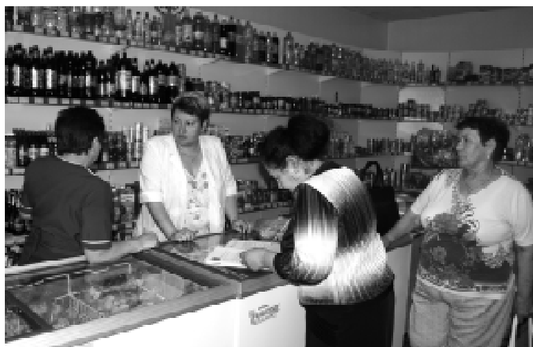
«Народный контроль» за работой

Фальсифицированный продукт под видом сливочного масла может нанести существенный вред жизни и здоровью потребителей, так как в основе спреда — растительное пальмовое или кокосовое масло, непривычное для жителей Челябинской области, которое может вызвать аллергичес-