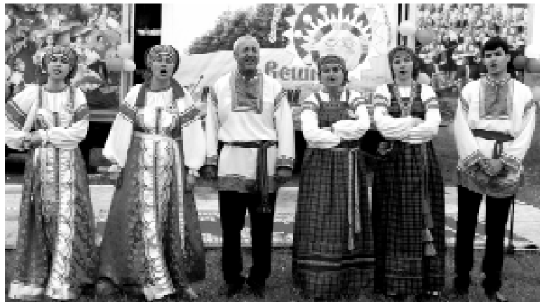
Гости фестиваля народный ансамбль фольклорной песни «Колечко» п. Бреды

Остальные коллективы стали Дипломантами фестиваля, среди них: Каракульский народный хор казачь-