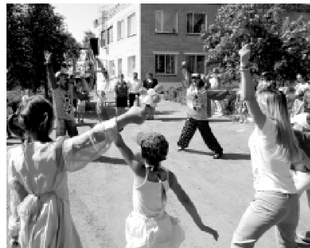
Фото и текст Надежды ЛЕТОВОЙ