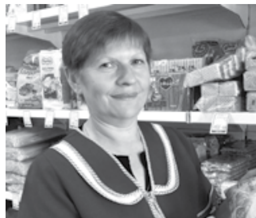
Фото и текст Надежды ЧЕРНЫШЕВОЙ

семейного благополучия, всех земных благ и надеемся, что нас будут связывать еще долгие годы совместной работы.