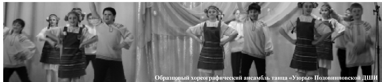
Образцовый хореографический ансамбль танца «Узоры» Подовинновской ДШИ