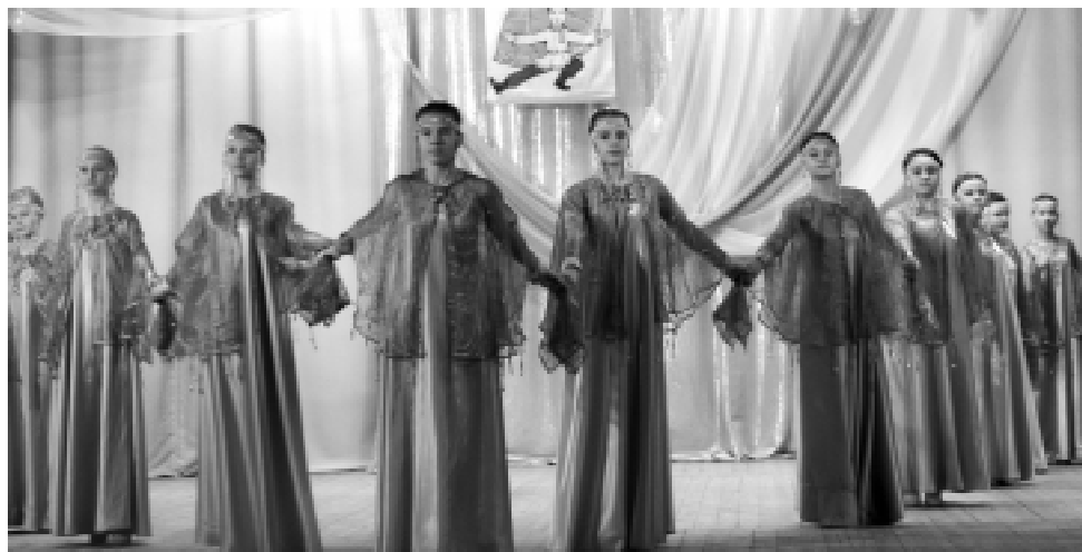
Образцовый хореографический ансамбль танца Октябрьской ДШИ

Трагический пафос витал на сцене, когда танцовщицы хореографического ансамбля «Первоцвет» Дома детского творчества исполняли танец «Синий платочек», ансамбль «Родничок» с. Новомосковское — «Катюшу», образцовый хореографический коллектив «Узоры» Подовинновской ДШИ — хореографическую картинку «Дети войны», образцовый хореографический коллектив Октябрьской ДШИ — «Сухопояс». Данная тематическая танцевальная программа соединила в себе лучшее из накопленного вчера и найденного сегодня. В танцевальных постановках патриотической тематики были отражены важные аспекты истории: память, вера, возрождение. Помимо хореографической драматургии, отраженной в танцах, зрители видели