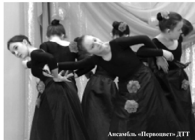
Ансамбль «Первоцвет» ДДТ