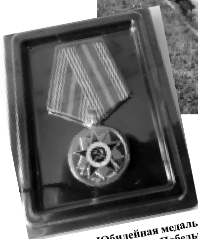
Юбилейная медаль к 70-летию Победы