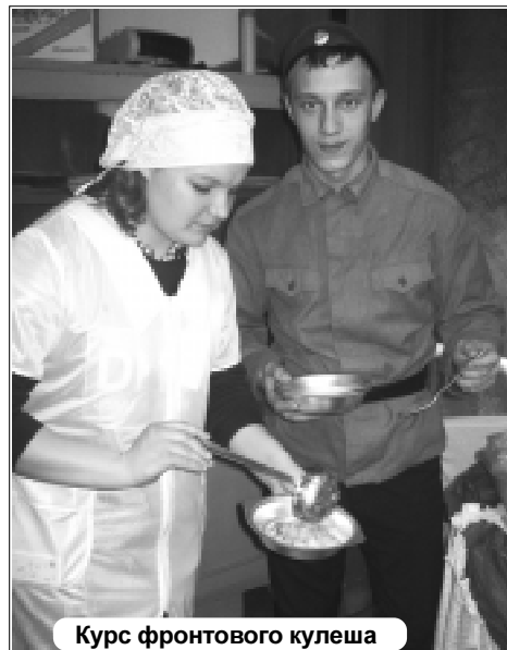
Курс фронтного кулеша