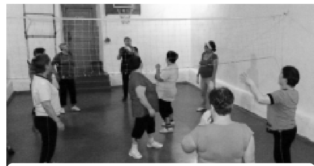
На игровой площадке их просто не узнать!