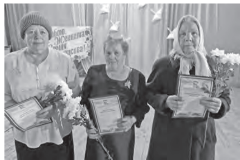
Труженицы сельского хозяйства