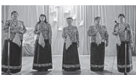
Вокальная группа «Сударушки»