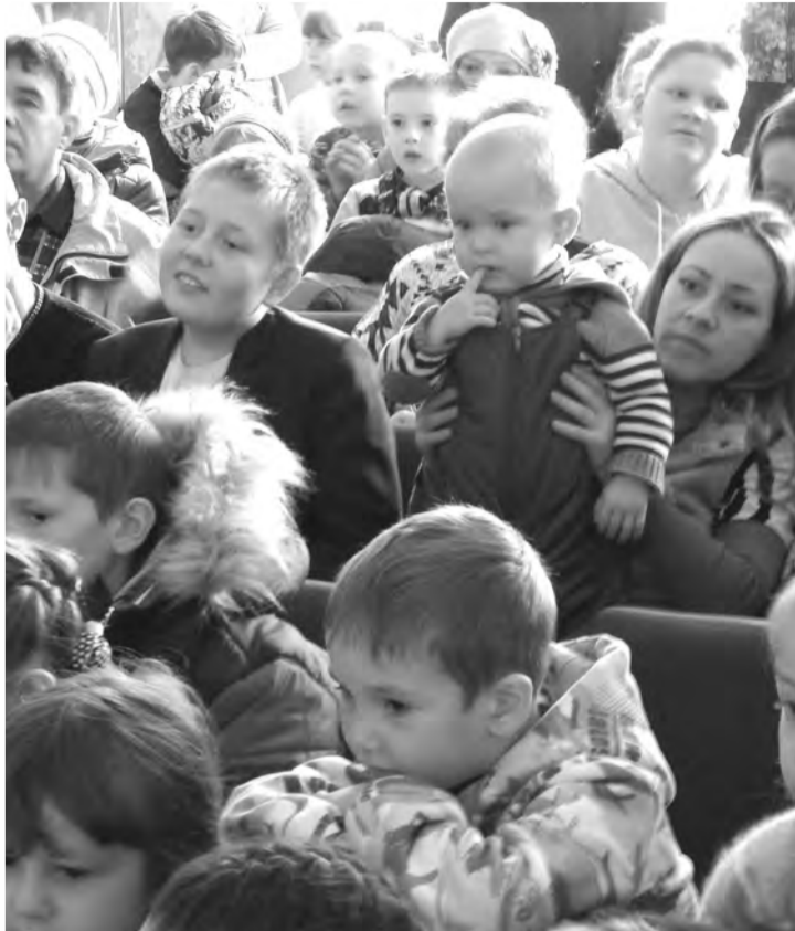
Игра актеров завораживает и маленьких, и взрослых зрителей

— Меня с самого детства водили на кукольные спектакли, мой отец работал директором клуба, поэтому я и детей приучаю к культурной жизни. Это очень хорошо, что в наш район приезжают на гастроли с концертами, проводят у нас областные фестивали, в город ведь не наездишь