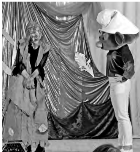
Сцены из спектакля «Таина волшебной книги»