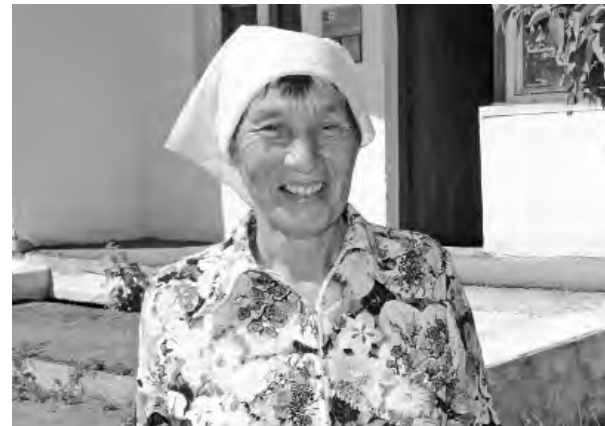
Важная профессия на селе

В День пожилого человека на страницах газеты хочется рассказать о ветеранах сельского хозяйства, которые находятся на заслуженном отдыхе.