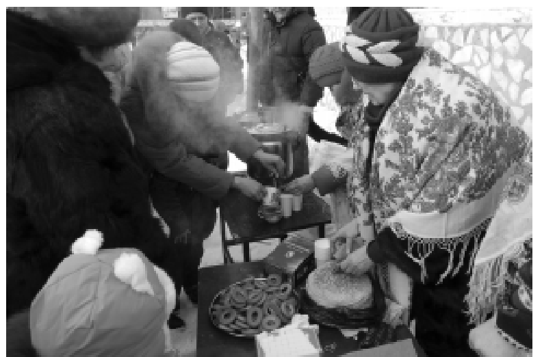
У горячего самовара

много собралось на этот раз на площади молодежи, детворы, а ведь это приобщение к культурным народным традициям и обычаям, которые почитаются и передаются из поколения в поколение.