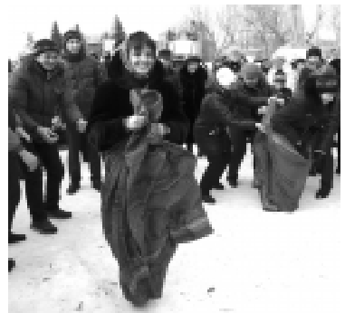
Эстафета «Бег в мешках»