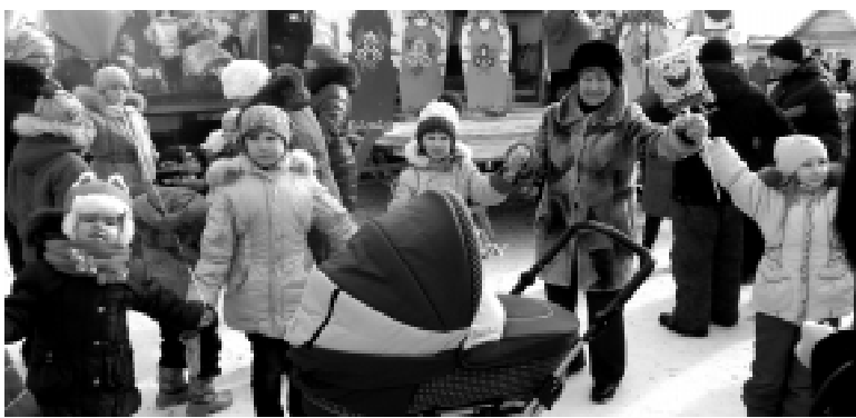
Самая большая семья Ременец