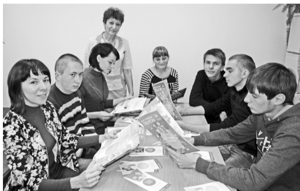
Красочные буклеты вызвали интерес у студентов

На данном мероприятии участники встречи узнали о принципах пенсионной системы России, порядке формирования пенсии работающих граждан,