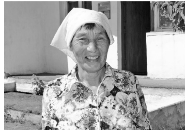
Важная профессия на селе

В День пожилого человека на страницах газеты хочется рассказать о ветеранах сельского хозяйства, которые находятся на заслуженном отдыхе.