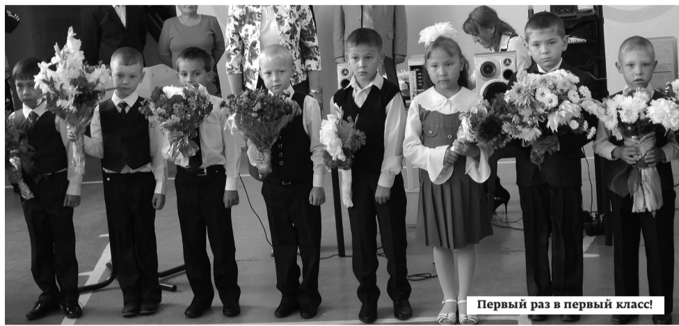
Первый раз в первый класс!

1 сентября во всех школах района прошли торжественные линейки, посвященные началу нового учебного года. Нам удалось побывать на Дне знаний в Уйско-Чебаркульской школе.