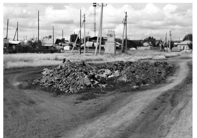
Ни пройти, ни проехать