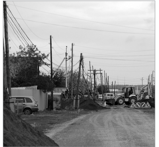
Газификация ул. Колхозная

Состоялся также аукцион по ремонту улично-дорожной сети. В текущем году на эти цели выделены средства в размере 2 млн. рублей из област-